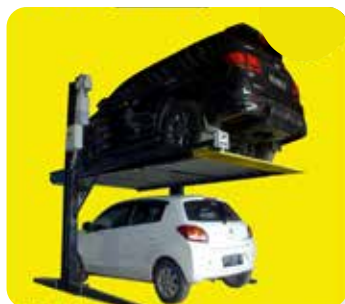
2 Post Car Lift