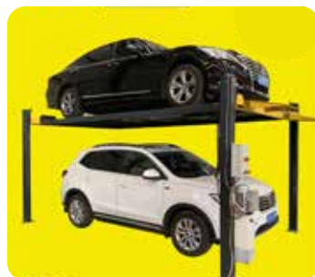
4 Post Car Lift