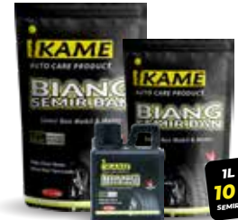
BIANG SEMIR BAN

5L, 1L, 500ml Membuat ban kendaraan anda tampak seperti baru, dan mempertahankan warna hitam pada ban kendaraan Anda.