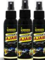
PENKILAP AJAIB 100ML

1L, 500ml, 250ml, 100ml Befungsi untuk membersihkan minyak atau oli dan kotoran lain yang menempel pada kompartemen mesin mobil, kolong mobil, dsb.