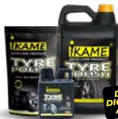
TYRE POLISH PREMIUM

1L, 500ml, 250ml, 100ml Befungsi untuk membersihkan minyak atau oli dan kotoran lain yang menempel pada kompartemen mesin mobil, kolong mobil, dsb.