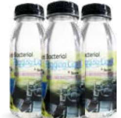
LIQUID FOGGING 100ML

Praktis (bisa langsung digunakan) Dengan kandungan PREMIUM SILICONE (WAX) dan UV GUARD untuk efek dan proteksi maksimal