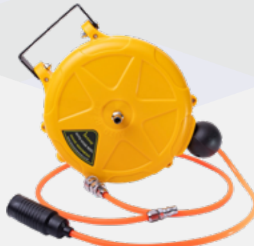
AIR HOSE REEL TY-1