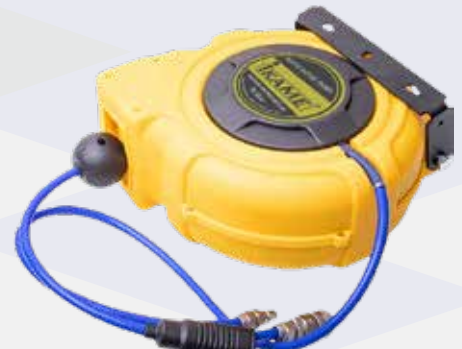
AIR HOSE REEL TY-2