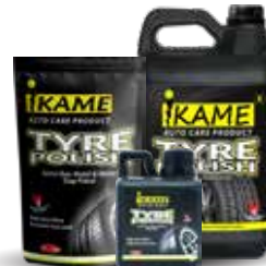
TYRE POLISH SIAP PAKAI

5L, 1L, 500ml Memiliki bahan dasar Silicon yang diformulasikan dengan solven pilihan berfungsi sebagai perlindungan dan perawatan ban kendaraan.